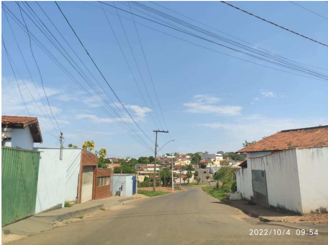
Rua Antônio Simões Borges