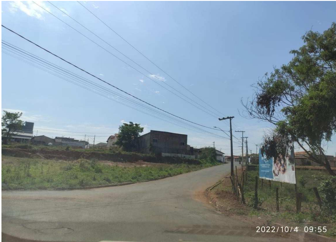
Rua Antônio Simões Borges