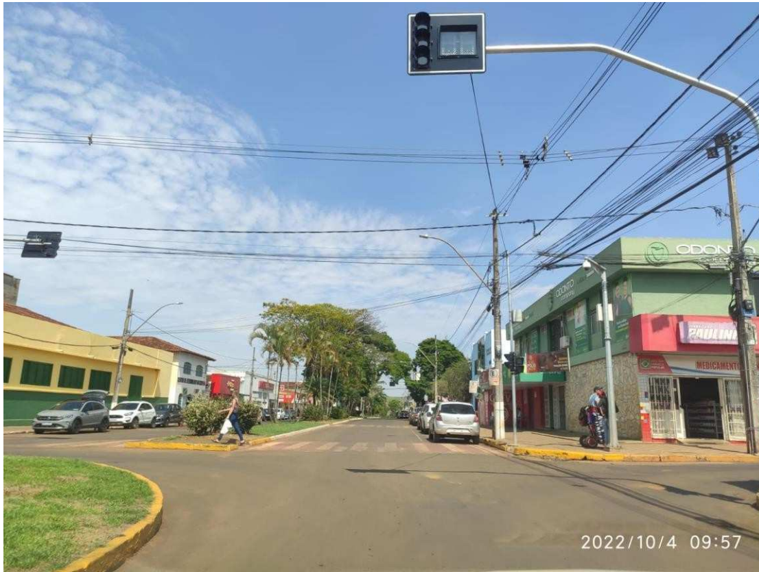
Avenida Gercino Coutinho