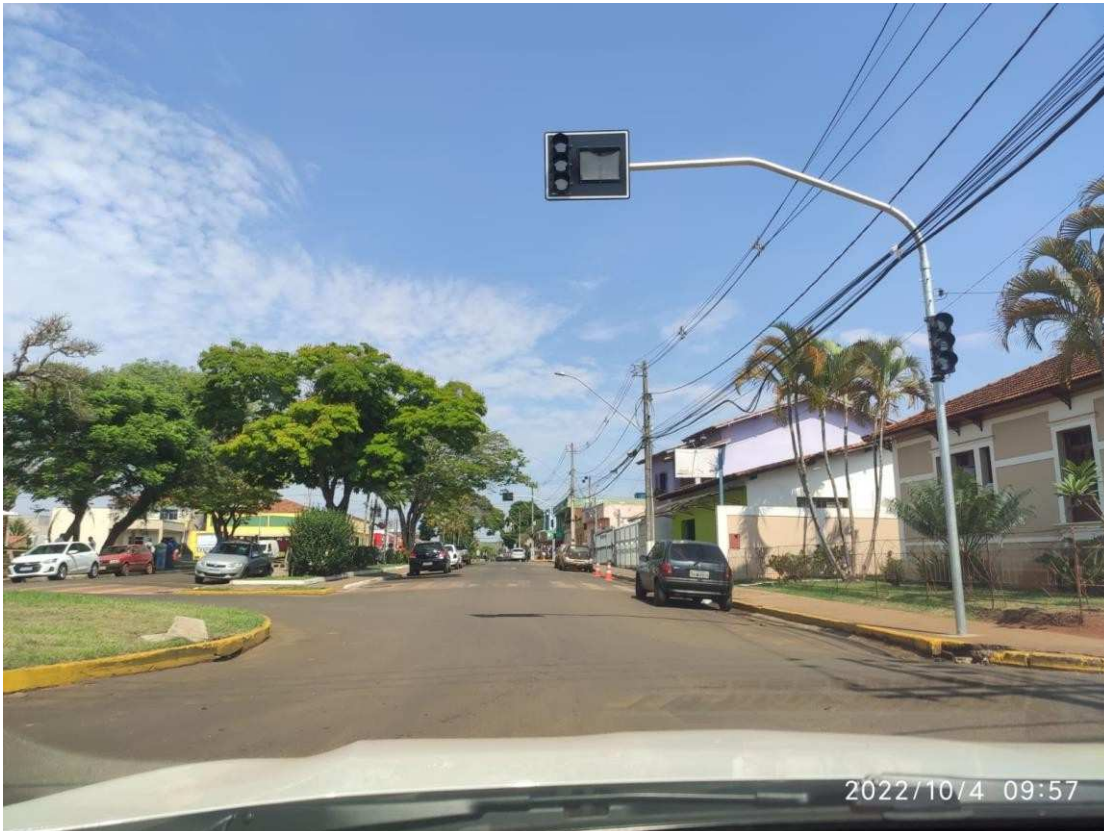
Avenida Gercino Coutinho