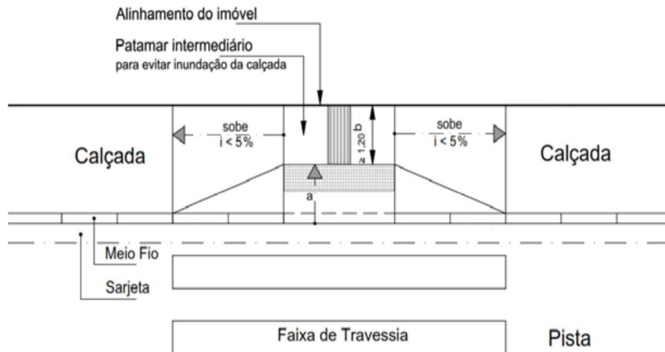
Imagem 02 – Modelo de rampa para Calçadas com estreiras Fonte: NBR 9050/2020