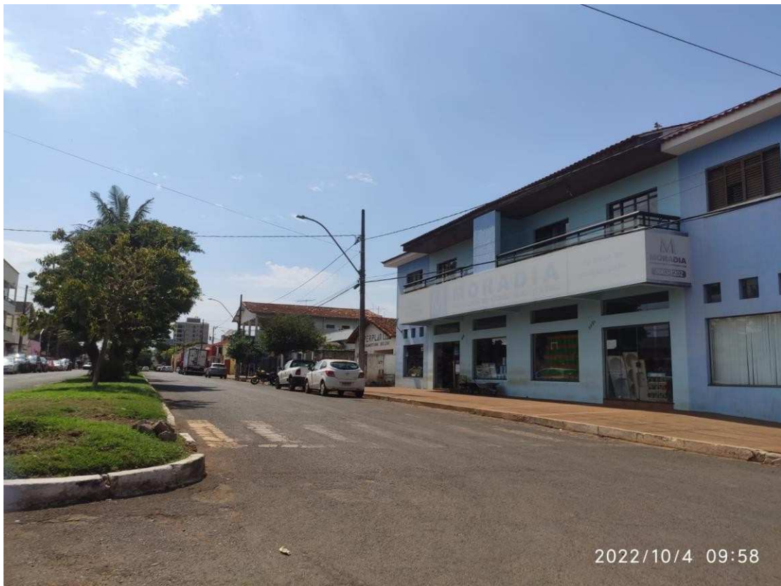
Avenida Gercino Coutinho